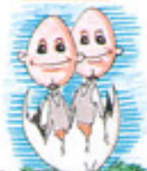
Géminis ( )