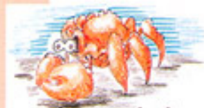
Cáncer ( )