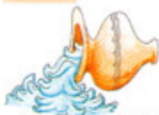
Acuario ( )