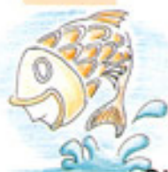
Piscis ( )