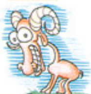
Capricornio ( )