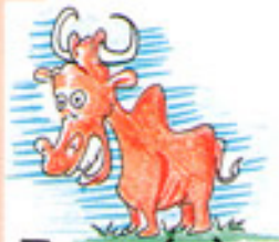
Tauro ( )