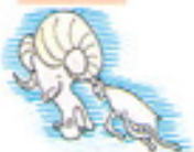
Aries ( )

Relaciona las columnas siguientes, tomando en cuenta tu signo zodiacal, tus cualidades y defectos y los de tus amigos o compañeros: